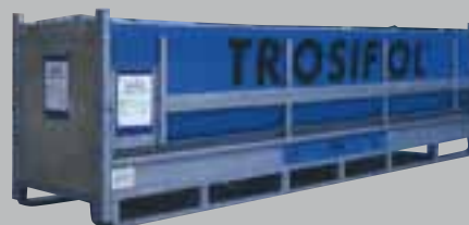
Embalaje retornable – horizontal