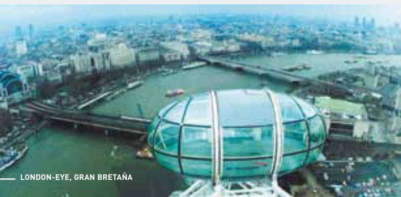
LONDON-EYE, GRAN BRETAÑA