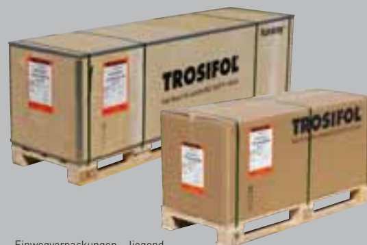
Einwegverpackungen – liegend