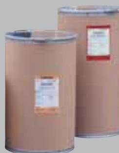
Trommelverpackungen – stehend