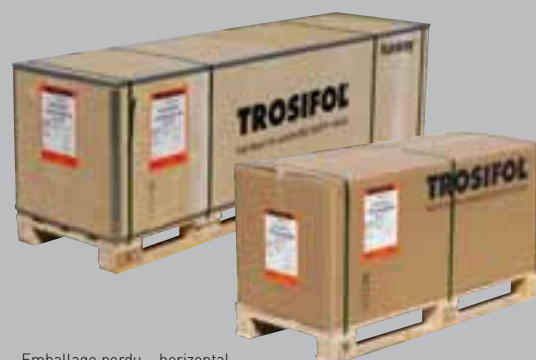
Emballage perdu – horizontal