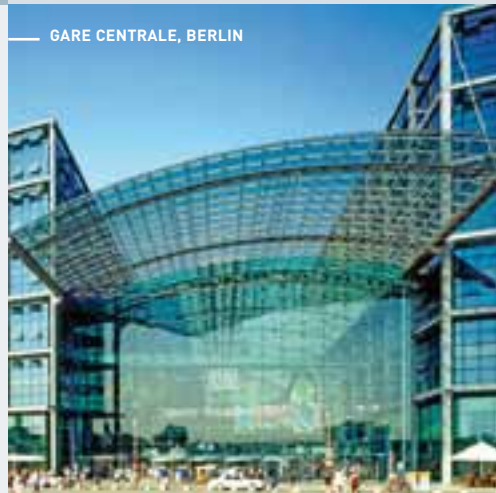
GARE CENTRALE, BERLIN