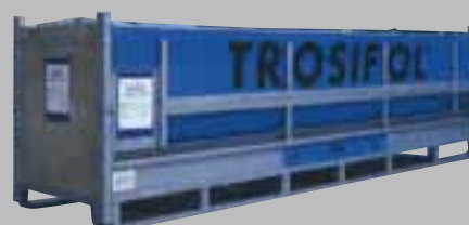
Mehrwegverpackungen – liegend