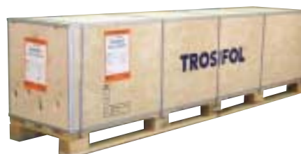
Einwegverpackungen – liegend