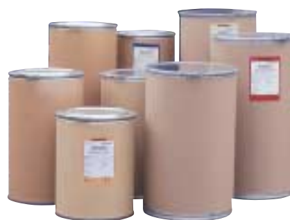
Trommelverpackungen – stehend