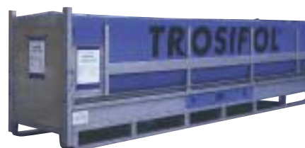
Mehrwegverpackungen – liegend