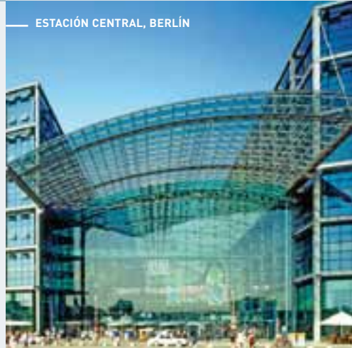
ESTACIÓN CENTRAL, BERLÍN